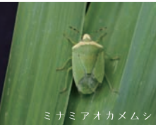
ミナミアオカメムシ