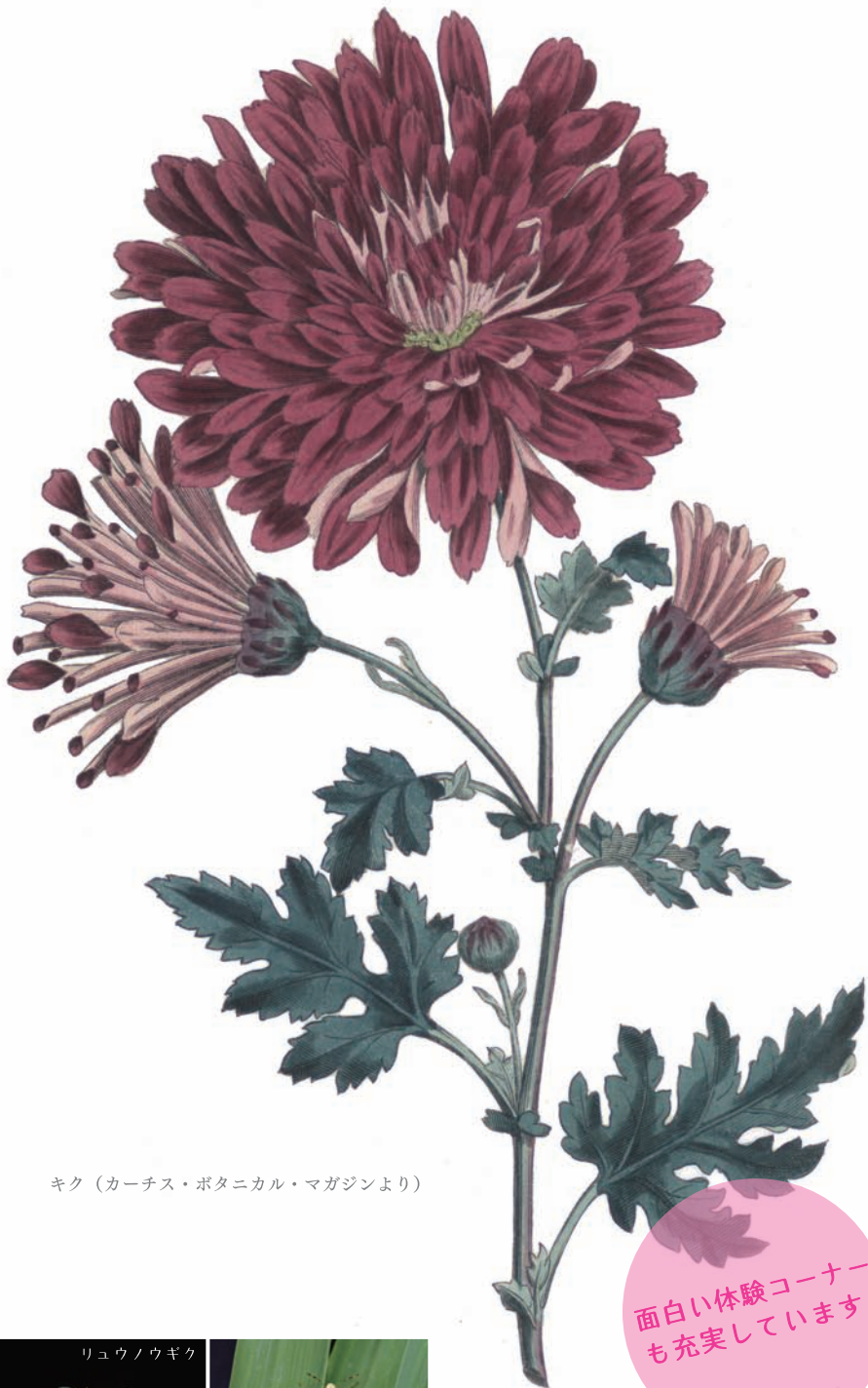
キク（カーチス・ボタニカル・マガジンより）