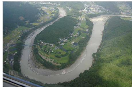
だこう 大きく蛇行する那賀川。 この蛇行も那賀川秘密の一つ。

なかがわ 那賀川流域の豊かな自然と人々のくらしには秘密がいっぱい！ それを博物館の蔵出し資料 くらだ で紹介します。