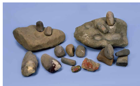
しゆ 朱の産地として全国的に有名な若杉山遺跡の遺物