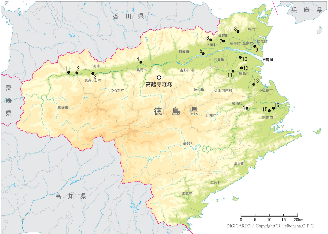
図2 高越寺経塚と中世阿波における常滑焼の出土遺跡