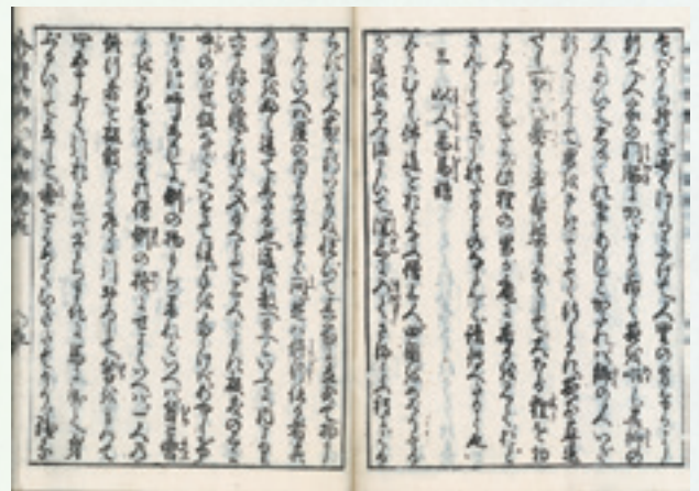
図1 四国を巡る僧についての説話（考訂今昔物語 和朝部〔当館蔵〕より）

ここで、大峰・葛城山系をはじめとする、山伏の行場となっていた各地の霊山に見られた「宿」という場に注目してみます。宿とは、山中における仏神の居所、行場としての峰、滝、川、洞窟などのことで、寺社が整備されている場合もありました。修行ルート いんぎょ の固定化の中で定着した、いわば通過ポイントです。