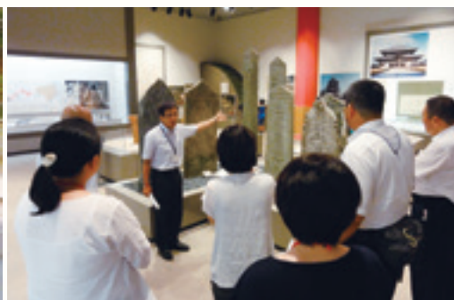
図2 常設展示室で中世の石造物「板碑」の解説