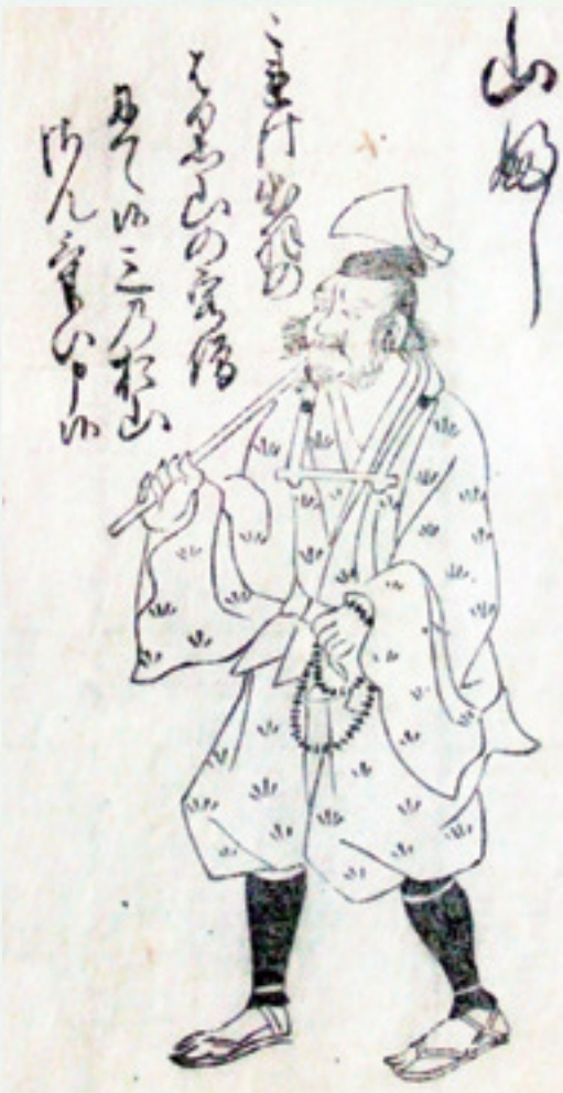
図3 中世の山伏(七十一番職人歌合[当館蔵]より)

以上、中世における山伏の修行の特質に注目して、四国遍路における札所巡拝という形態の源流と再編の流れを推論してみました。この考え方の当否は、今後の研究のなかで明らかになっていくことと思います。 (歴史担当)