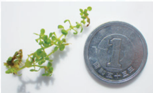
図1 道ばたで見つけたアワゴケ

博物館への出勤途中で見慣れない草を見つけました。とても小さな草で、大きさは5cmほど。葉っぱの大きさは5mmもないほどです。毎日前を通る度に、遠目に見て「何だろう?」と思っていたのですが、朝のせわしい時間ということもあり、そのままにして時間が過ぎていました。そうこうする内、“中級クラス植物観察会”という普及行事の日になりました。