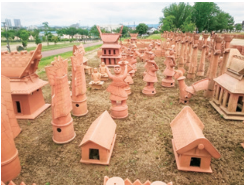
図1 大阪府高槻市今城塚古墳（6世紀前半）の復元された埴輪群