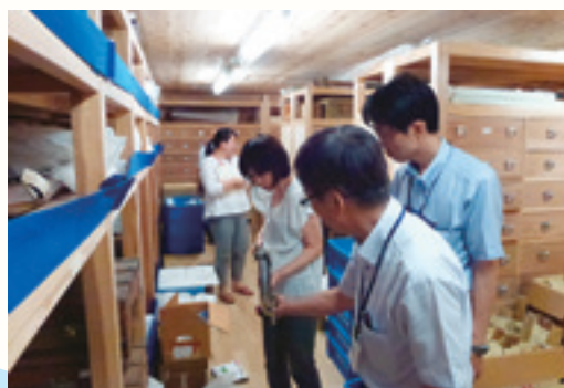
図3 歴史民俗収蔵庫で火縄銃に触れる