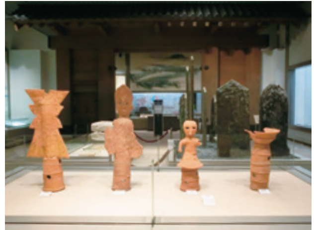
図2 県立博物館の小松島市前山遺跡の埴輪（6世紀）