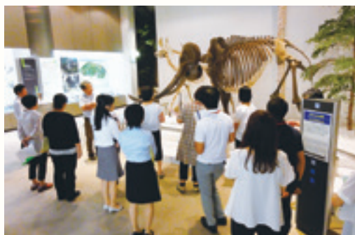
図1 常設展示室でナウマンゾウの解説