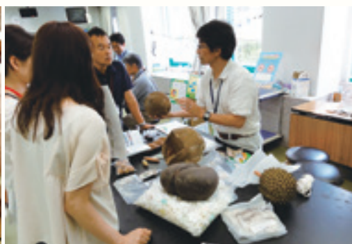
図4 学校用貸し出し資料「いろいろな種子」