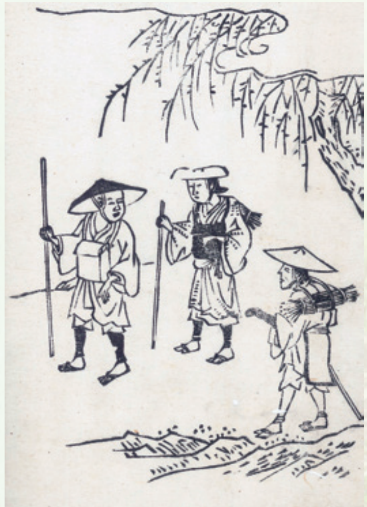
図4 江戸時代の遍路の姿(四国徧礼道指南増補大成[当館蔵]より)