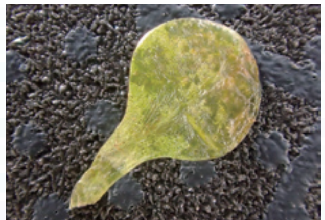
図3 葉。しゃもじ型の柄の部分の葉柄で1mm程度の長さがある