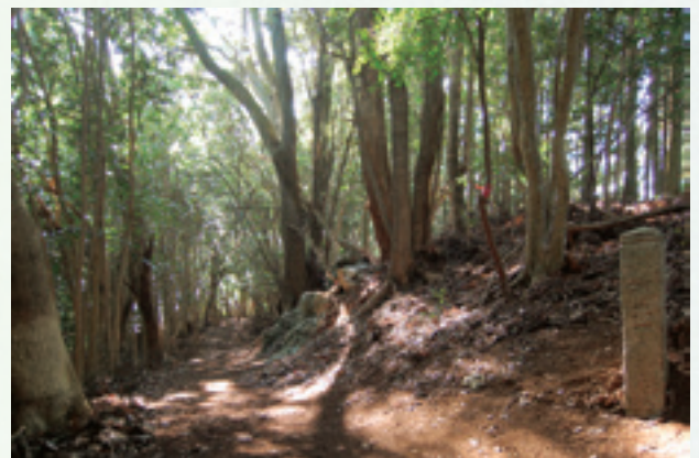
図2 太龍寺の参詣道「かも道」

平安時代の説話集『今昔物語』を簡略にまとめた江戸時代の史料。四国辺地を巡る僧（聖）の話をもとにした「人をもって馬と為る語」が掲載されています。