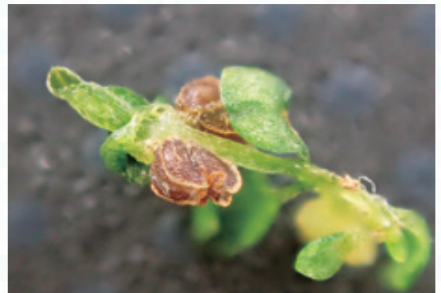
図2 アワゴケの拡大写真。中央の茶色い物が果実。ふちはやや翼状に薄くなるのがわかる