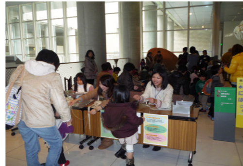
2012年度イベントの様子 (博物館常設展示室内)

県立博物館では、博物館職員と一緒に子ども向けのイベントを企画、準備、実行していただけるスタッフ（ボランティア）を募集しています。多くの方が、博物館に親しんでいただけるような楽しいイベントを一緒につくりましょう。