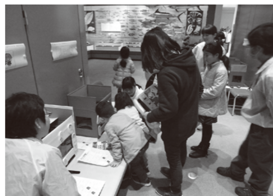
ボランティアスタッフと学芸員による 博物館常設展示室でのイベントの様子 (平成 28 年 2 月 11 日)

どなたでも。年齢・性別・経験等は問いません。 ※小学生以下の方は、保護者の方と一緒に参加をお願いします。 お子様づれでの参加も大歓迎です。