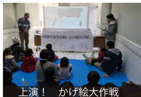
上演！かげ絵大作戦

ボランティアスタッフと学芸員による 博物館常設展示室でのイベントのようす (平成 29 年 2 月 11 日)